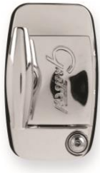
9025 Hinged Bracket 12,7 mm für Rack Toms und Floor Toms