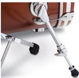
Standard G9013 spurs