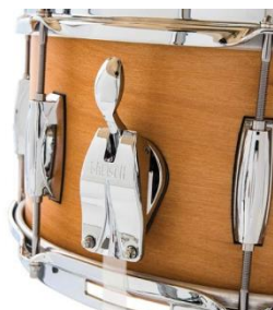
Lightning Snare Abhebung