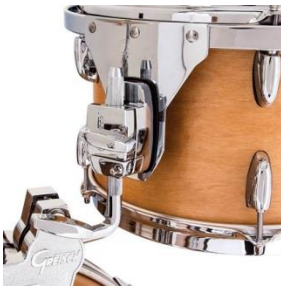
Standard GTS Tomhalterung