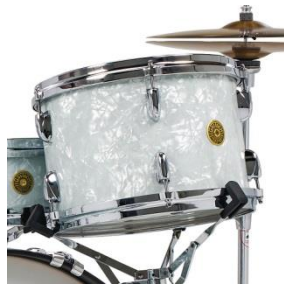
Keine Tomhalterung (für Snare Ständer)