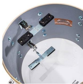
Dämpfer Schlag- und/oder Resonanzseite