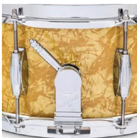
Micro Sensitive Snare Abhebung