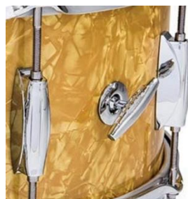
Snap-In Key Holder